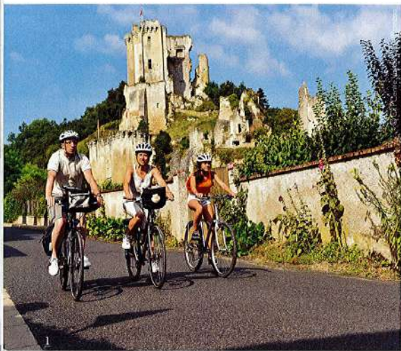
1-2/ En vélo ou en canoë, les Syndicats du Pays Vendômois et du Pays Dunois comptent développer une offre d'itinérances douces pour permettre aux touristes de découvrir la région du Centre-Val de Loire. Ce territoire souhaite s'imposer comme une destination de country-break de prédilection pour la clientèle francilienne.